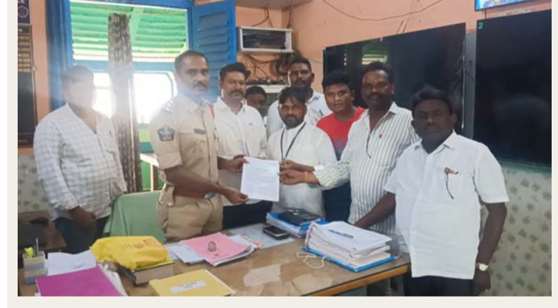
రన్ న్యూస్ ఆళ్లగడ్డ/సంద్యాల జిల్లా ప్రతినిధి ఈనెల 14న అంబేద్కర్ జయంతి సందర్భంగా బహిరంగ ర్యాలీ నిర్వహిస్తున్నట్లు జై భీమ్ మాల సంఘం నాయకులు ప్రజాసంఘాల నాయకులు పేర్కొన్నారు. ర్యాలీ నిర్వహణకు అనుమతి ఇవ్వాలని సీబి యుగంధర్ ను కోరారు. 14న అంబేద్కర్ 135వ జయంతి కార్యక్రమానికి హాజరుకావాలని కోరిట్ల తెలిపారు. ఆళ్లగడ్డ తహసీల్దార్ కార్యాలయం నుంచి నాలుగు రోడ్లు కూడలి అంబేద్కర్ విగ్రహం వరకు బహిరంగ ర్యాలీ ఉంటుందన్నారు. కార్యక్రమంలో వివిధ పార్టీ, ప్రజా సంఘాల నాయకులు పాల్గొన్నారు.