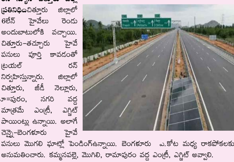
రన్ న్యూస్ చిత్తూరు జిల్లా ప్రతినిధి చిత్తూరు జిల్లాలో అలీన్ హైవేలు రెండు అందుబాటులోకి వచ్చాయి. చిత్తూరు-తమ్మూరు హైవే పనులు పూర్తి కావడంతో బ్రయల్ రన్ నిర్వహిస్తున్నారు. జిల్లాలో చిత్తూరు, జీడీ నెల్లూరు, లా-పురం, నగరి వద్ద మాత్రమే ఎంఐ, ఎగ్జిట్ పాయింట్లు ఉన్నాయి. అలాగే చెన్నై-బెంగళూరు హైవే పనులు మొగలి ఘాట్ల పేరింగి ఉన్నాయి. బెంగళూరు ఎ.కోట మధ్య రాకపోకలకు అనుమతించారు. కమ్యూనల్, మొగలి, రామాపురం వద్ద ఎంఐ, ఎగ్జిట్ అవ్వాలి.