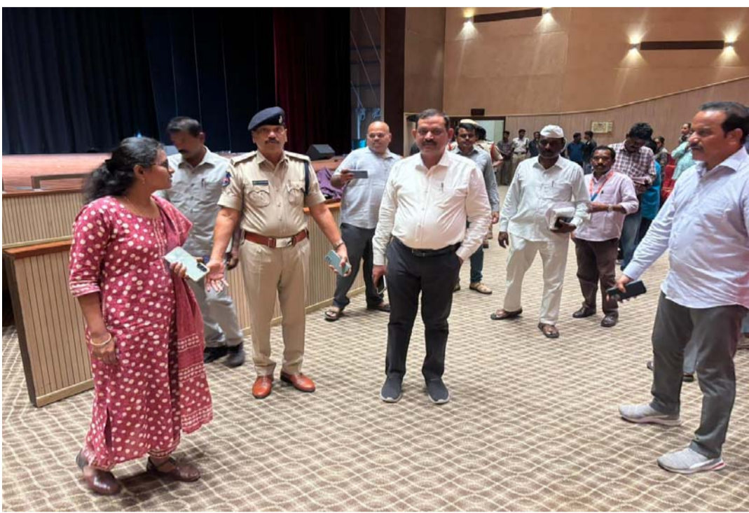
ఉదయం 10 గంటలకు ప్రారంభమయ్యే ఈ కార్యక్రమంలో డ్రైవర్లు, ఆటో డ్రైవర్లు, విద్యార్థులు మరియు ఇతర వర్గాల ప్రజలు అధిక సంఖ్యలో పాల్గొనాలని కోరారు.