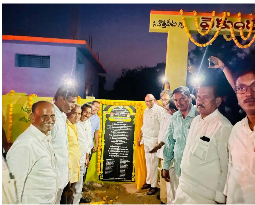
జరుగుతుందని పేర్కొన్నారు. గ్రామాభివృద్ధి తన ప్రధాన లక్ష్యమని స్పష్టం చేసిన ఎమ్మెల్యే ప్రతి గ్రామంలో రోడ్లు, శృశానవాటికలు వంటి మౌలిక వసతులను అభివృద్ధి చేయడం ద్వారా ప్రజల జీవన ప్రమాణాలను పెంచడమే తన ధ్యేయమని తెలిపారు. భవిష్యత్తులో మరిన్ని అభివృద్ధి కార్యక్రమాలు చేపట్టి ప్రతి గ్రామాన్ని ఆదర్శ గ్రామంగా తీర్చిదిద్దడానికే తన ప్రయత్నం ఉంటుందని తెలిపారు. ఈ కార్యక్రమం సందర్భంగా గ్రామ టీడీపీ నాయకులు ఎమ్మెల్యే గారిని కాలువా, పులమాలో ఘనంగా సత్కరించారు. కార్యక్రమంలో స్థానిక ప్రజా ప్రతినిధులు, పార్టీ నాయకులు, గ్రామ పెద్దలు, మహిళలు, యువత పెద్దసంఖ్యలో పాల్గొని కార్యక్రమాన్ని విజయవంతం చేశారు.